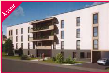
LES BAUMES Valence Agence Valence Sud Construction en VEFA de 27 logements