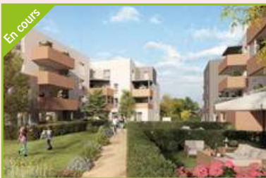
SOLARIS Valence Agence Valence Est Construction en VEFA** de 16 logements