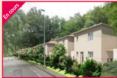
LE CLOS DU BOIS Valence Agence Valence Sud Construction de 14 villas (dont 2 en AS*)