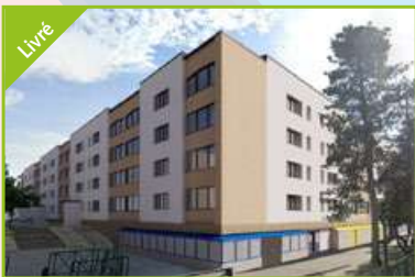
KOALA Valence Agence Valence Est Réhabilitation de 100 logements