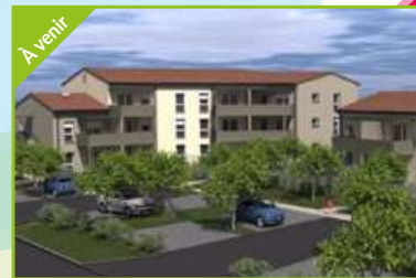
LA BAYOT Valence Agence Valence Est Construction de 17 logements