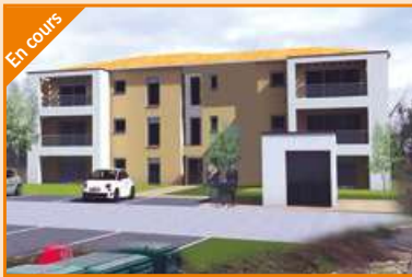
SAINT-MARCEL-LÈS-VALENCE Agence Valence Nord Construction de 9 logements