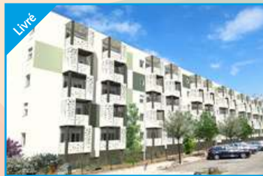
LE COLIBRI Valence Agence Valence Centre Réhabilitation de 60 logements