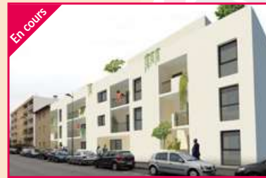
LE VERGER DE VALENSOLLES Valence Agence Valence Sud Construction de 20 logements