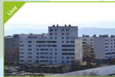
LOUISIANE PHENIX Valence Agence Valence Est Réhabilitation de 131 logements