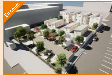
LES BLEUETS Valence Agence Valence Nord Construction de 16 logements