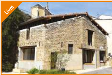
LA FORGE Châteauneuf-sur-Isère Agence Valence Nord Construction de 2 logements