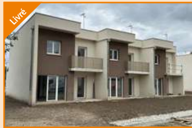
RÉSIDENCE LOUISE DUPIN Valence Agence Valence Nord Construction de 18 villas (dont 3 en AS*)