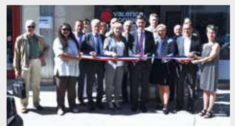
Agence Romans Centre