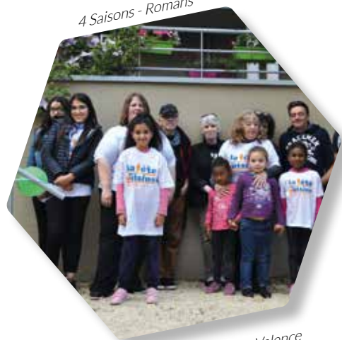
4 Saisons - Romans