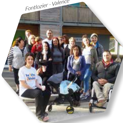
Fontlozier - Valence