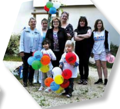
Salamanca - Romans