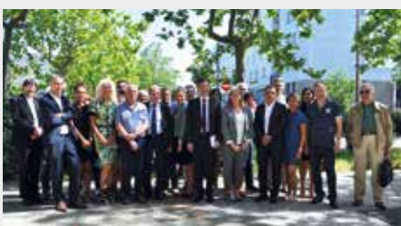
Agence Romans Est